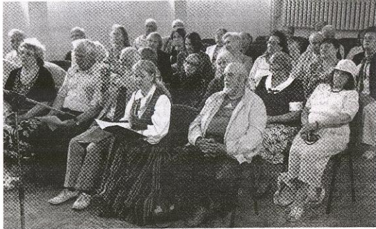
Literatūrinio žodžio puoselėtojai kasmet susitinka Jonavoje, Suaugusiųjų švietimo centre.