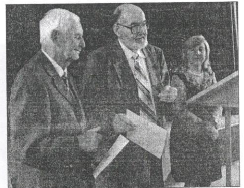
Renginio akimirka.