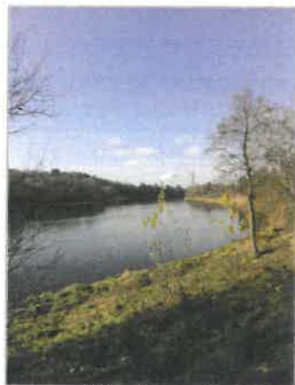
Neries upė ties Salenykų kaimu.